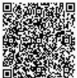
Persembahan - Kantong 1 Pengeluaran Rutin Gereja